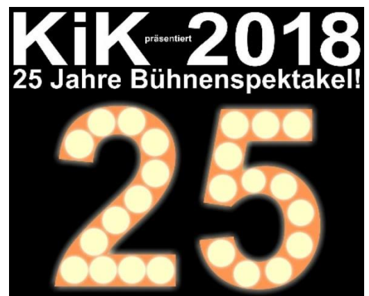
KiK 2018: 25 Jahre Jubiläum (Werbepplakat)

planen, ...) hatte sich wieder einmal gelohnt!