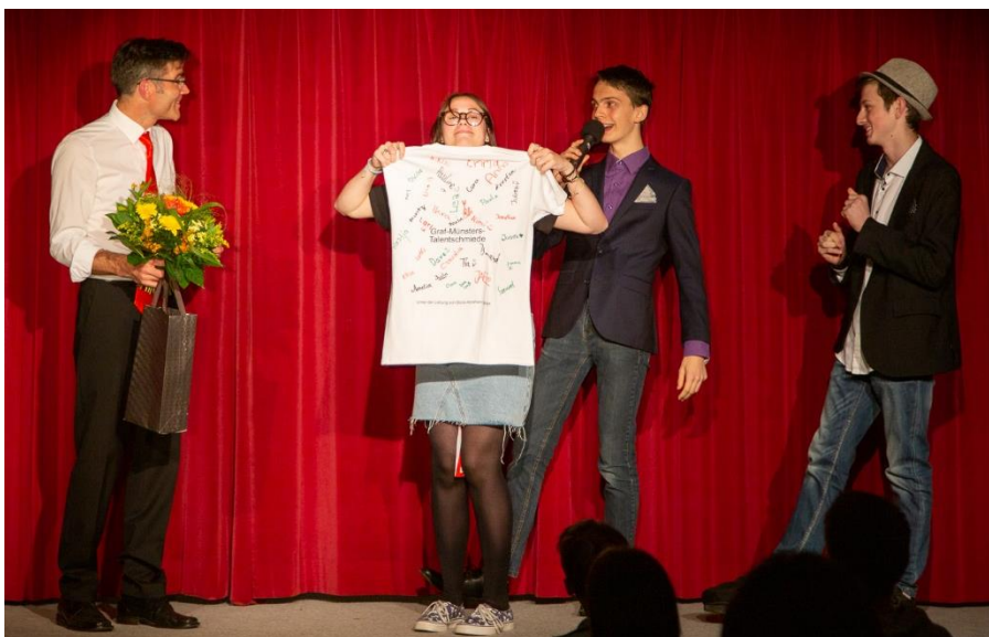
Leistung: im Team am schönsten!

Wir machen bei GMTS natürlich weiter mit der genialen Mischung aus kreativem Wahnsinn, musikalischer Finesse, farbgewaltigen Bühnenbildern und improvisiert-geplanter Witzigkeit. Du, weretes Publikum, bist wie jedes Jahr herzlich zu unseren Bühnenshows willkommen!