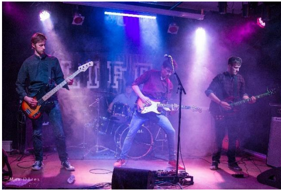
Die Band LIFF vom GMG rockt die Bühne!

Ebenfalls klar war: die Marke „KiK“ hatte sich im Lauf der Jahre weiterentwickelt: die Bühnenshows hatten ja nichts mit dem gleichnamigen Textildiscounter oder dem „Kick“ oder mit der sprichwörtlichen „Kultur“ zu tun. Es ging immer darum, jungen Ta-