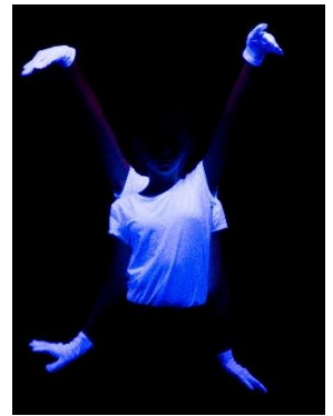
Dance Act im Schwarzlicht

Ebenfalls klar war: die Marke „KiK“ hatte sich im Lauf der Jahre weiterentwickelt: die Bühnenshows hatten ja nichts mit dem gleichnamigen Textildiscounter oder dem „Kick“ oder mit der sprichwörtlichen „Kultur“ zu tun. Es ging immer darum, jungen Ta-