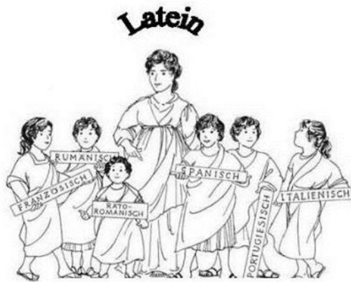
Mutter Latein und ihre Töchter